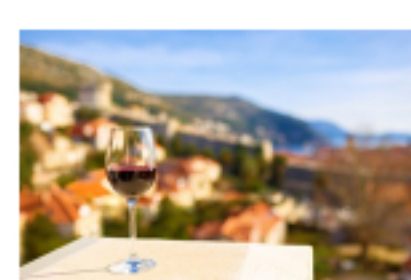
Chorwacja. Kraj winem płynący

Na narty ... autem, autokarem czy samolotem? Samodzielnie czy z biurem podróży?