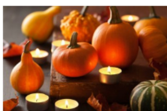
Dyńnia nie tylko na Halloween