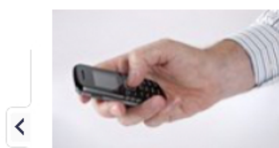
Uwaga na fałszywe połączenia telefoniczne z egzotycznych kra...