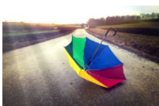
Meteopatia to nie choroba