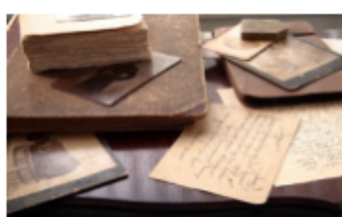
Znajdź przodków w archiwach państwowych